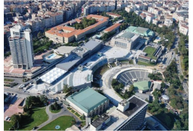
İstanbul Kongre Vadisi Istanbul Congress Valley

*VIP Otoparkı yoktur. VIP Carpark is not available